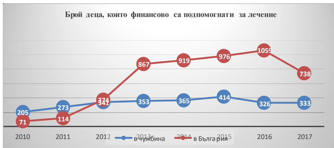
Фиг. 2. Сравнение по години на брой деца, финансирани от ЦФЛД

Общата картина на финансовото подпомагане на лечението на деца в България и в чужбина, осъществено от ЦФЛД през последните години е дадена в таблица №4.